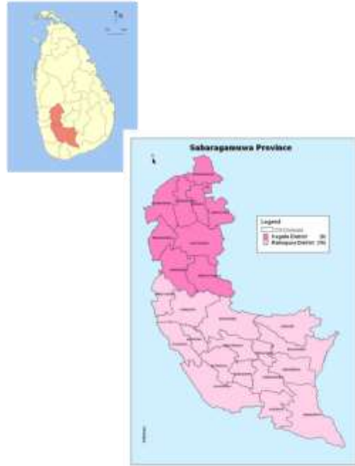
සිතියම 01: සබරගමුව පළාත් සිතියම